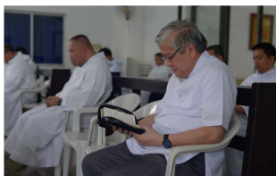
As imagens mostram os capitulares rezando a oração da manhã. A foto em cima do lado direito mostra o Arcebispo Dom Sócrates Villegas, D.D. rezando com os delegados do 7º Capítulo Provincial.