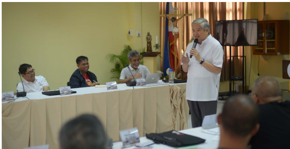
O Arcebispo Dom Sócrates Villegas, DD divide momento de desconcentração com os delegados durante o retiro espiritual.

Para o melhor entendimento do que é o discernimento, na espiritualidade Inaciana; o Dom Sócrates enumerou os seguintes passos. Primeiro, ele falou sobre humildade. Humildade é essencial na nossa vida, mas nós não devemos orgulhar disso. No momento que a gente fala sobre nossa humildade, nos já a perdemos e fazer o contrário. O Dom Sócrates também compartilhou com os capitulares esta citação sobre humildade,